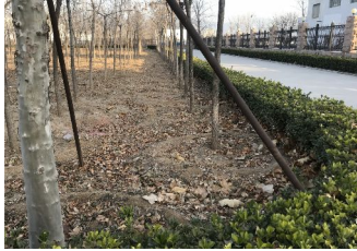
(新城供热厂清理后)

东小口供热片区： 我供热片区本周安全大排查情况，4名正式工无旷工脱岗情况，两处锅炉房5名司炉工均持证上岗，锅炉房内灭火器检查中，未发现压力不足的灭火器，嗅敏仪测试未发现燃气管道接口处有漏气现象，锅炉房内消防报警柜，燃气报警箱运行正常，锅炉超温超压测试正常。宿舍内没有跟工作无关的东西，工作工具摆放整齐，宿舍内严禁吸烟无老化插线板及高功率电器，无过期发霉食品，季节工无吵架摩擦情况。