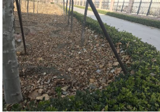
(新城供热厂清理前)

新城供热厂： 根据总公司开展的为期40天的安全生产隐患排查、大清理、大整治专项行动，新城供热厂立即组织人员进行供热厂、宿舍、交换站的安全隐患排查，根据排查后的结果组织维修工、微机员、电工、化验员进行清理，具体排查治理情况如下：1、检查职工宿舍和各住人交换站，发现符合《关于开展非公司物品清理行动的通知》内容的物品较多，如供热厂宿舍内有电视机、冰箱和一些淘汰的家具，兴昌交换站宿舍的电视，张营交换站宿舍的电视，供热厂根据清理行动的要求已全部清理，并要求职工对宿舍进行整理，保持宿舍干净整洁。2、各职工宿舍检查发现使用的插线板有九几年的老旧插线板，自制的明盒还有已经存在隐患的，根据这些情况，供热厂统一更换成公牛有开关的插线板，并做好收缴废旧插线板和新插线板发放记录。3、安排供热厂、住人各交换站的负责人对自己的维修人员再一次进行安全教育，要求对消防安全知识、用电安全知识、有限空间作业知识和五项规定、维修工岗位说明书、关于严禁在岗期间饮酒等不良行为的管理规定、维修人员在岗行为规范进行学习，并做好安全教育记录，同时还要去各宿舍吸烟职工，吸烟时必须开窗通风，吸烟后必须用水浇灭烟头，确保宿舍不留安全隐患。